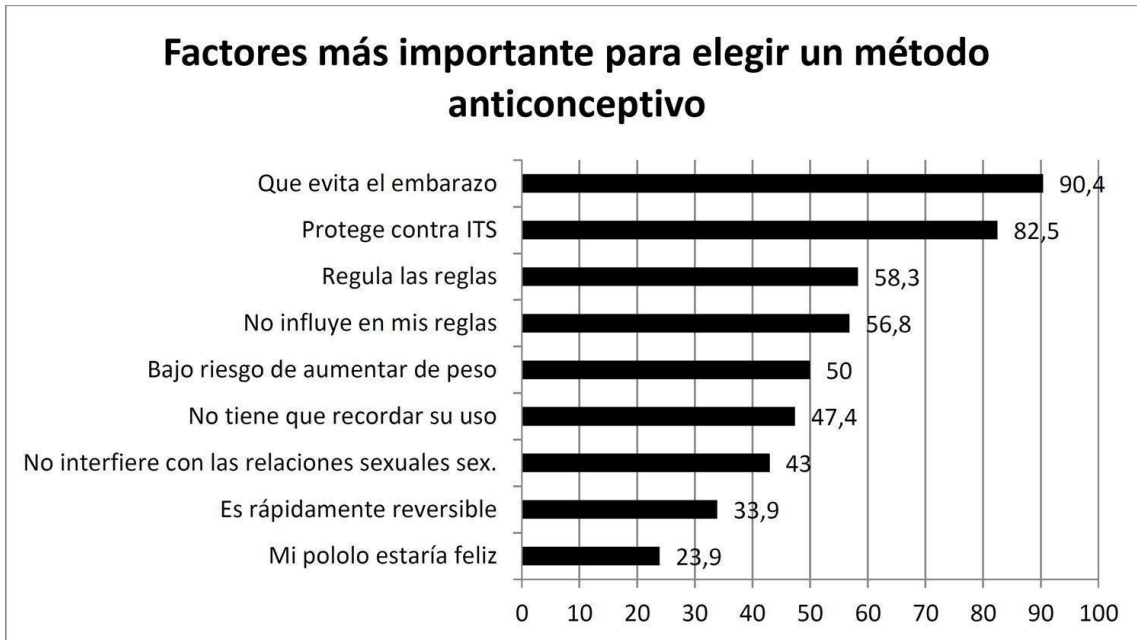
Gráfico n° 1.: Factores más importantes para elegir un método anticonceptivo

Según la información extraída a fecha de 2018, entre los métodos anticonceptivos considerados más efectivos destacaron el parche anticonceptivo y el anillo vaginal. En ambos casos, se trata de métodos hormonales de larga duración (gráfico n°2)